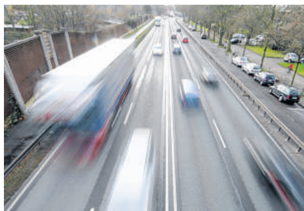
Blick auf die B 224: Hier könnte die Bundesstraße bei einem Ausbau in einen Tunnel verschwinden.

Die Jugendlichen machen einen bedeutenden Teil der Stimmen beim Ratsbürgerentscheid aus: Immerhin 3730 Jugendliche im Alter zwischen 16 und 20 Jahren sind wahlberechtigt. Und sie betrifft das Ergebnis am meisten: Sie sind diejenigen, die vom Ausbau oder vom Nicht-Ausbau am längsten betroffen sein werden.